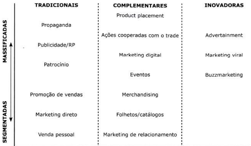
Figura 1: Elementos do mix de Comunicação de marketing 15

A figura 1 que segue apresenta de modo objetivo quais são os mix de comunicação de marketing que se pode aplicar nas empresas classificadas em cinco categorias.